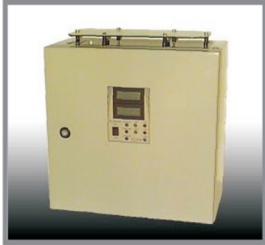
DC-DC Wandler 0,7kW 216V / 60V 10Amp Wandgehäuse B 400 H 400 T 200mm IP20