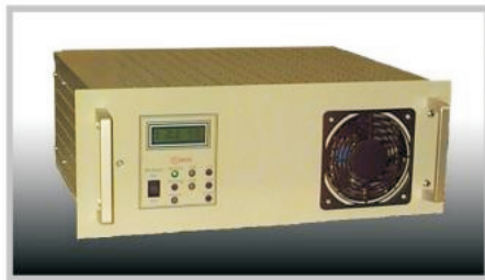
Wechselrichter 1,5kVA 110V DC 19" 4HE 360 mm tief IP 20